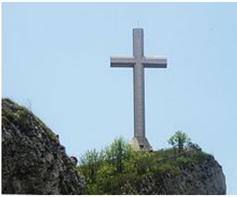
Paroisse La Croix-du-Nivolet